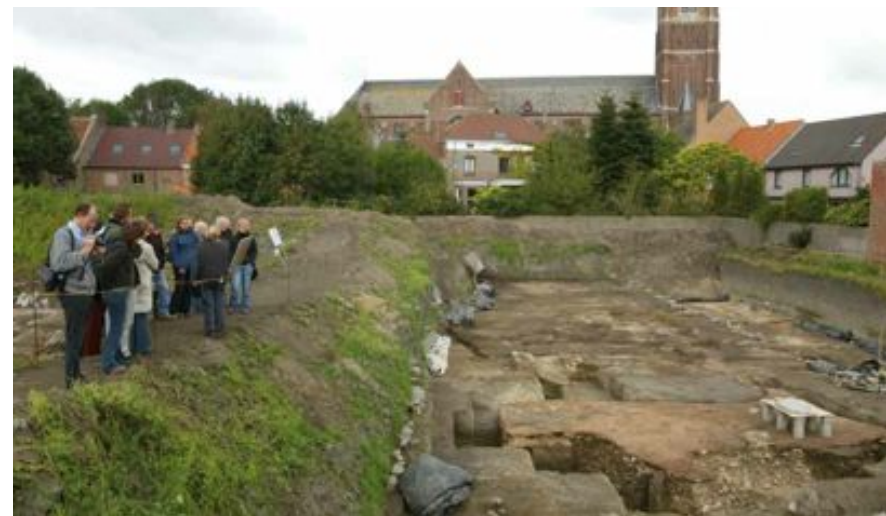
FIG. 4 Noodopgraving in Oudenburg

Om de leesbaarheid van de handleiding te bevorderen zijn tekst en ondertekeningen in een groter lettertype dan de voorgaande handleidingen afgedrukt. Op de website van het VIOE kan de handleiding in pdf naar behoeven verder uitvergroot worden.