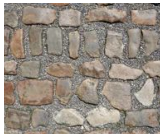
FIG. 16 Begijnhof van Diest Straatstenen die in fijn porfiergrind geplaatst worden, liggen vaster dan in straatzand. Toch moeten de voegen in en tussen rijen met kasseien in het algemeen en met kleine gepolijste vossenkopjes in het bijzonder smal zijn omdat de stenen dan stabiel liggen, niet de indruk geven in de porfiergrint te zwemmen en vooral minder hobbelig zijn, hetgeen de betreedbaarheid ten goede komt.