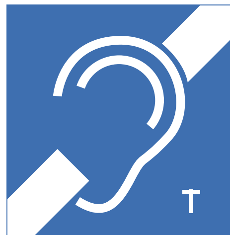
FIG. 25 Ringleidingen Ringleidingen zorgen ervoor dat mensen met een hoorapparaat met draadspoel via instelling op de T-stand, draadloos het geluid van bijvoorbeeld een kerk, een concert-, conferentie- of vergaderzaal zuiver kunnen beluisteren zonder versterking van de storende bijgeluiden.