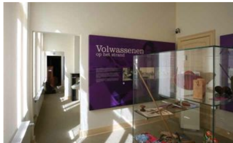
FIG. 7 Museum Kusthistories in Middelkerke Het Museum Kusthistories is gevestigd in het beschermde voormalige Postgebouw van Middelkerke. De nieuwe muuropeningen bevorderen de circulatiemogelijkheden en daardoor de ontsluiting en de toegankelijkheid voor alle gebruikers.

Het is bij vergunningsplichtige werken aan publiek toegankelijke onroerend erfgoed ten zeerste aangewezen om het agentschap Ruimte en Erfgoed vanaf het begin bij het dossier van vergunningsplichtige werken aan beschermd erfgoed te betrekken. Het agentschap moet immers conform artikel 35 van het Besluit van de Vlaamse Regering van 5 juni 2009 tot vaststelling van een gewestelijke stedenbouwkundige verordening betreffende toegankelijkheid, in zijn adviezen de afweging maken betreffende de vereisten van toegankelijkheid en het behoud van de erfgoedwaarden.