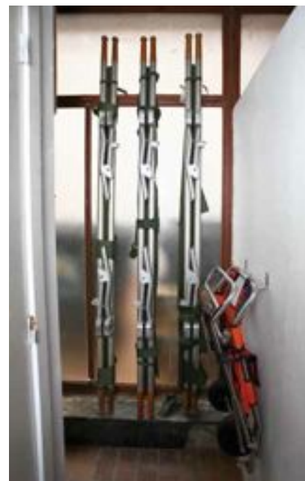
FIG. 26 Kunstencentrum Vooruit in Gent

Uit onderzoek blijkt dat juist oudere slechthorenden meer moeite hebben met het gebruik van ondertiteling omdat zij minder informatie tegelijk kunnen verwerken. Automatische spraakherkenning staat nog in de kinderschoenen, maar er zit toekomst in. Naar mate automatische spraakherkenners sneller en nauwkeuriger werken en de gebruikers meer vertrouwd met het systeem zullen zijn, zal het comfort toenemen.