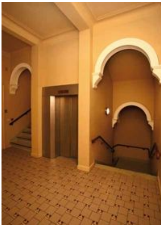
FIG. 19 Kunstencentrum Vooruit in Gent De kooilift is ingebouwd in de centrale traphal en bedient tot en met de derde verdieping.

Wegneembare hellingbanen lenen zich uitstekend voor het overbruggen van kleine hoogteverschillen waar vaste hellingbanen om erfgoedredenen niet aangewezen zijn.