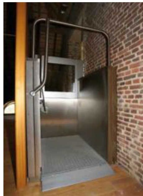
FIG. 8 Abdij Herkenrode De zolders van het hoevecomplex van de abdij zijn door middel van kooiliften ontsloten en toegankelijk gemaakt. Om de vloerniveaus van de zolders via het hoger vloerniveau van de centraalbouw met elkaar te verbinden moesten bijkomende trappen voorzien worden. Om de zolders ook voor rolstoelgebruikers met elkaar te verbinden, heeft de restauratie-architect platformliften voorzien. De platformliften en trappen zitten verscholen achter een gesloten houten wand die meteen ook dienst doet als borstwering voor het trapbordes.