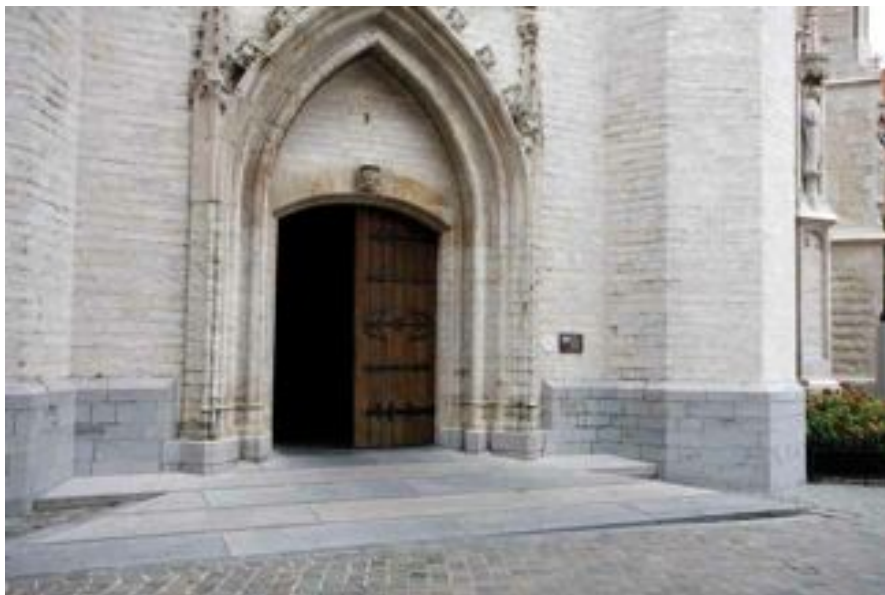
FIG. 5 Sint-Martinusbasiliek in Halle

Eenvoudige voorzieningen die inspelen op nieuwe noden betreffende toegankelijkheid - zoals trapleuningen - hoeven niet noodzakelijk in hedendaagse industrieel vervaardigde materialen zoals roestvrij staal, aluminium, glas of