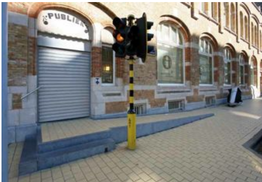
FIG. 17 Museum Kusthistorie in Middelkerke

Vaste hellingbanen zijn vanuit stabiliteitsredenen meer geschikt om grote hoogteverschillen op te vangen. Ze laten zich in de regel qua materiaal en afwerking ook goed integreren in onroerend erfgoed. Vaste hellingbanen moeten met dezelfde zorg behandeld worden als het onroerend erfgoed.