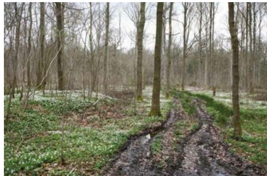
FIG. 6 Betere toegankelijkheid van beschermde landschappen is niet voor de hand liggend.

Een beschermde landschap is een landschap dat volgens dit decreet definitief beschermd is.